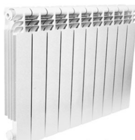
1. Біметалічні та алюмінієві